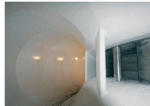
Povrstvení spirály (vodní elektrárna Dalešice) Spiral coat application (water power plant Dalešice)