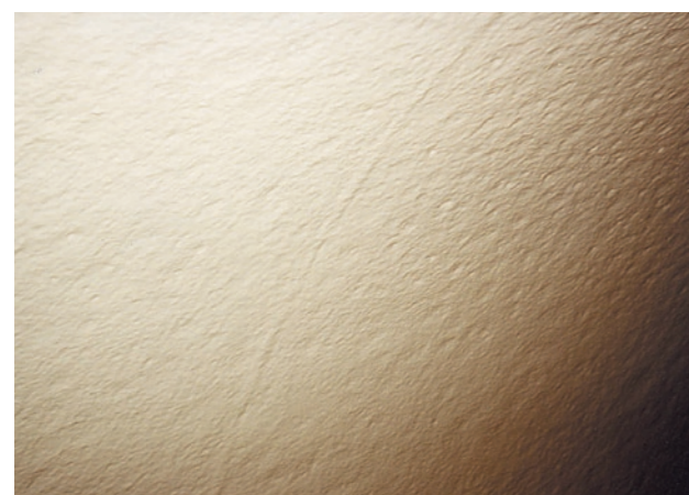
Detail povrchu po provedení nástřiku Surface detail after implementation of the jet-spray