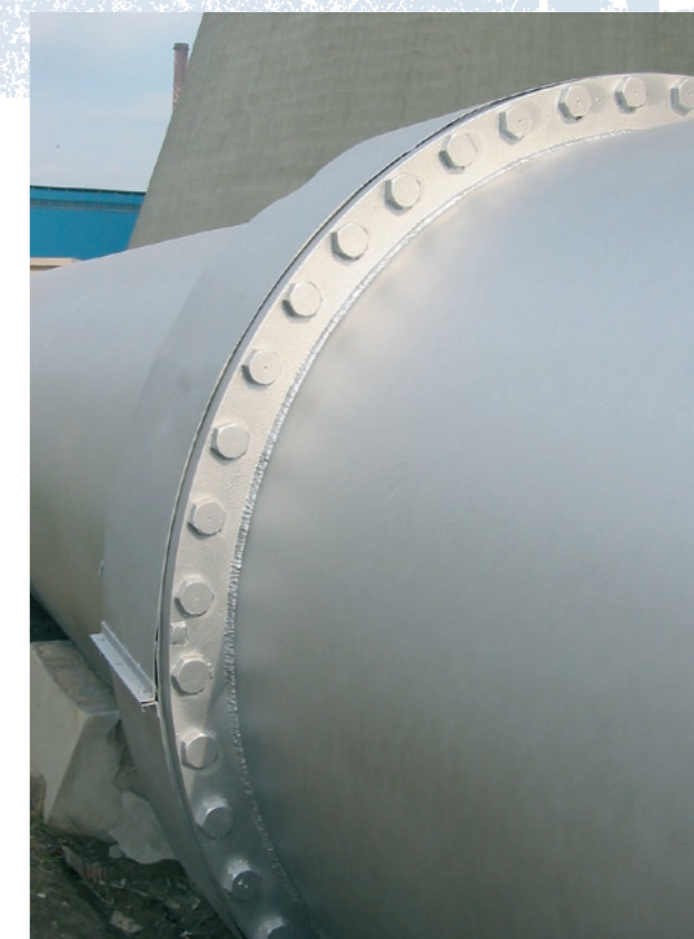
Potrubí po aplikaci antikorozičního systému Piping after the application of the anti-corrosive system

Applying a digging-free method, following double blasting, dust removal, and 100% moisture removal, we apply a specially modified epoxy highly dry material at the thickness of approx. 1 mm (in several mutually related layers).