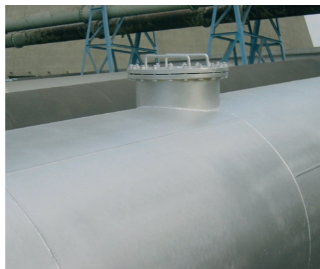
Potrubí po aplikaci antikorozičního systému Piping after the application of the anti-corrosive system