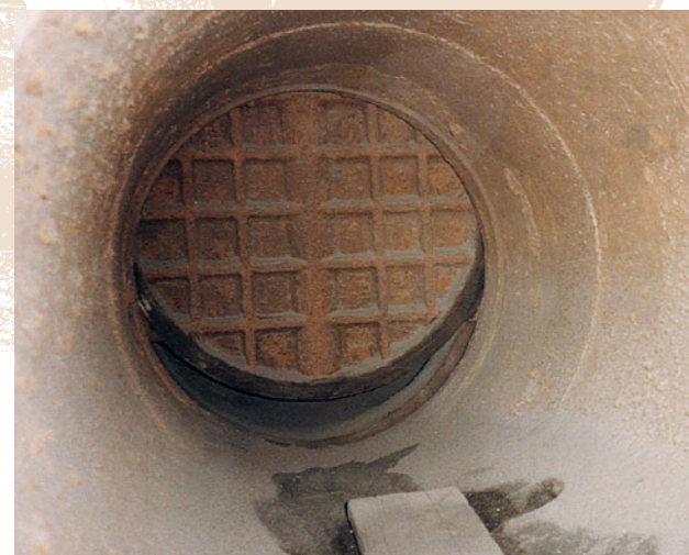
Zkorodovaný vnitřní povrch potrubí Corroded internal piping surface

Bezvýkopovou metodou, po dvojitým tryskání, odstranění prachu a 100%ním odstranění vlhkosti, aplikujeme v tloušťce cca 1 mm (v několika navazujících vrstvách) speciálně modifikovaný vysokosušivý epoxidový materiál.