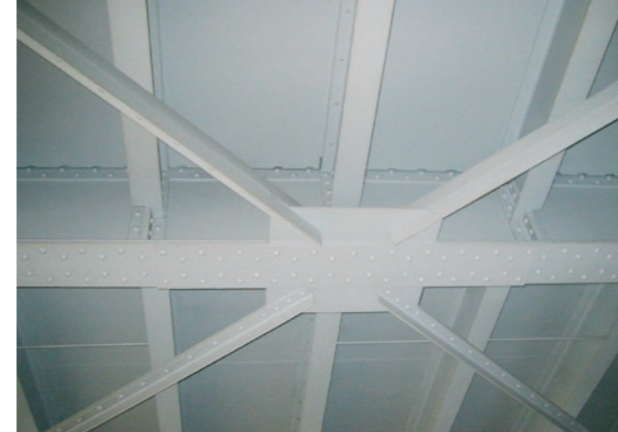
Aplikace nátěru na ocelové konstrukci Paint application on a steel structure

Po očištění povrchu (správně zvolenou metodou) a odstranění nečistot aplikujeme v několika vrstvách zvolený nátěrový systém. Při aplikaci neustále dodržujeme klimatické a technologické podmínky.