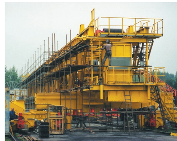
Povrchová úprava nakladače N 1250 - „Elektrárna Dětmarovice“ Loader surface treatment N 1250 - „Dětmarovice power plant“