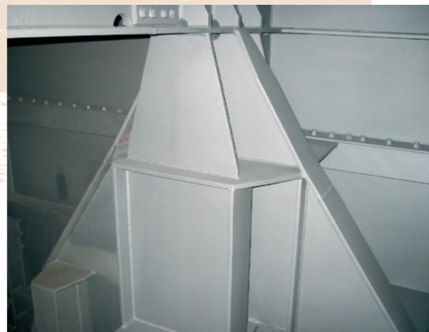
Po aplikaci nátěrového systému After the painting system application