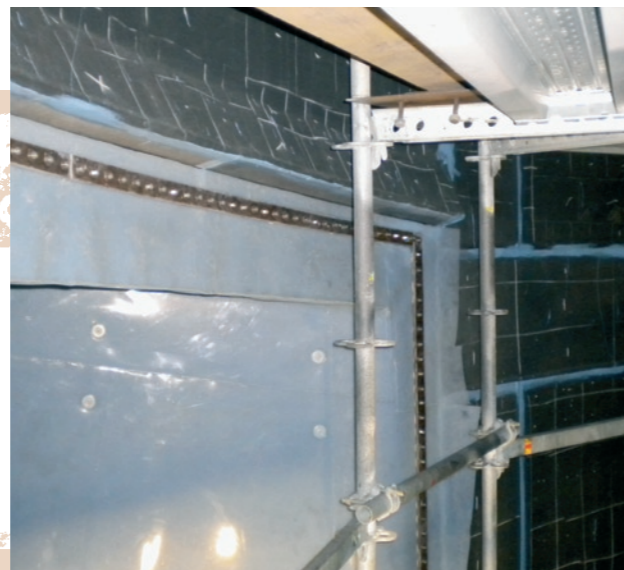
Ukončení obložení PFA Stopping lining PFA