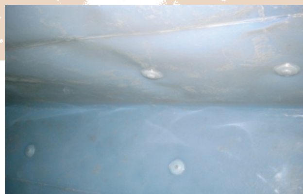
Detail obložení PFA Detail lining PFA