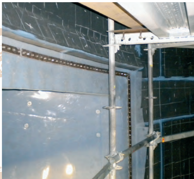
Ukončení obložení PFA Stopping lining PFA