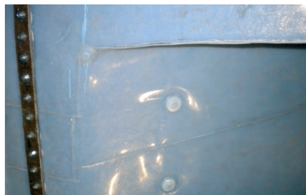
Přechodový detail Transition detail