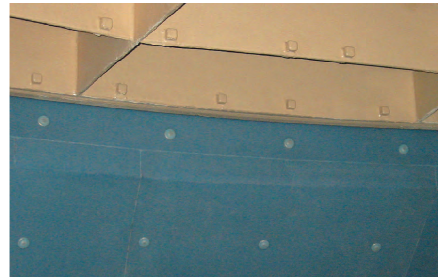
Obložení PFA (fluoropolymer) VGGH Covering PFA (Fluorine polymers) VGGH

Aplikujeme na různé povrchy i jako kombi povlaky s pryskyřicemi včetně přechodových řešení z materiálu na materiál. Po otryskání a aplikaci pryskyřičného povrstvení či přímo na neupravený povrch upevníme svorníky a přes speciální uchycení (podložka, matka, klobouček) uchytíme na povrch a svaříme průběžným svárem natěsno.