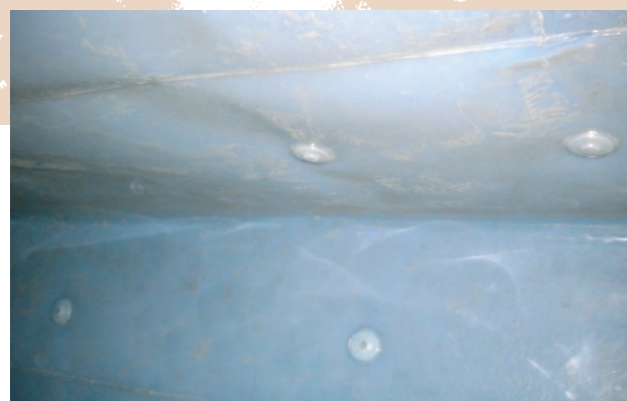
Detail obložení PFA Detail lining PFA