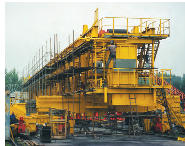
Povrchová úprava nakladače N 1250 - „Elektrárna Dětmarovice“ Loader surface treatment N 1250 - „Dětmarovice power plant“