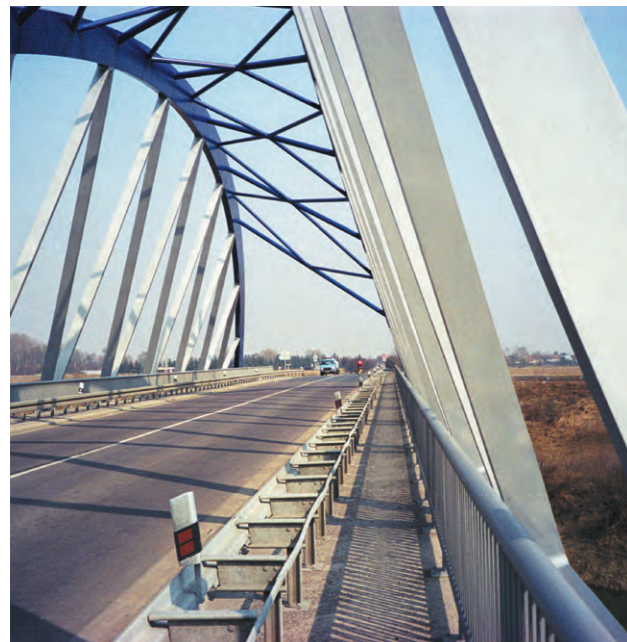
Most Troubky Troubky bridge

Základní ochranou ocelových konstrukcí jsou nátěry, které používáme hlavně v exteriérech. Naší volbou bývají všeobecně používané nátěrové systémy firem STEULER, SIGMA, HEMPEL, CARBOLINE a mnoho dalších. Je pouze na přání zákazníka, jaký systém si zvolí. Životnost a záruka patří potom nám.