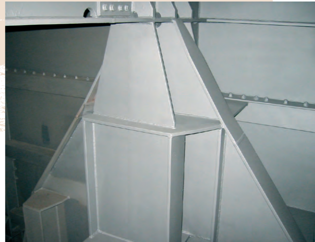
Po aplikaci nátěrového systému After the painting system application