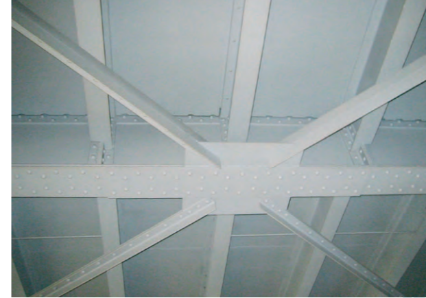
Aplikace nátěru na ocelové konstrukci Paint application on a steel structure

Po očištění povrchu (správně zvolenou metodou) a odstranění nečistot aplikujeme v několika vrstvách zvolený nátěrový systém. Při aplikaci neustále dodržujeme klimatické a technologické podmínky.