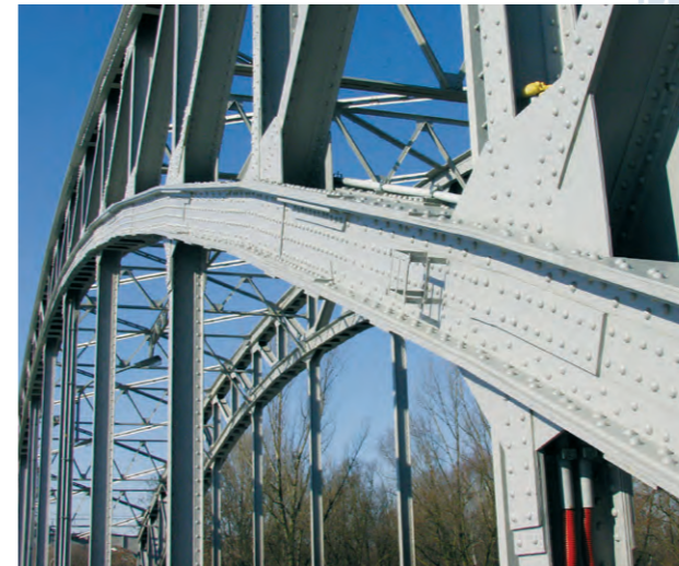
Most Petřkovice Petřkovice bridge