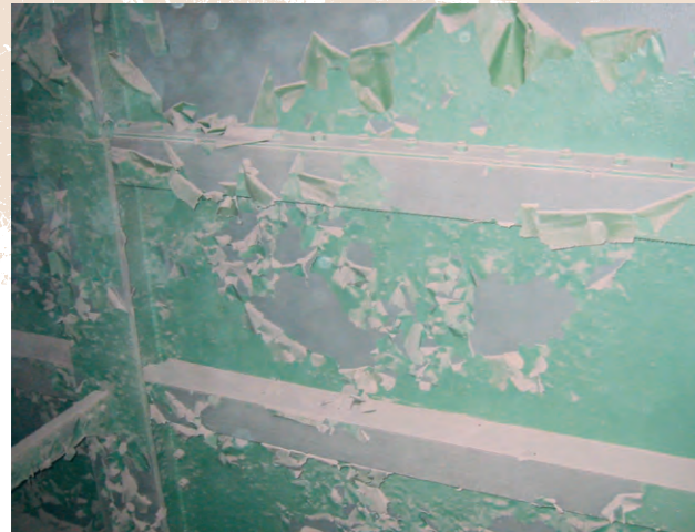
Starý nátěrový systém - interiér mostu Previous paint procedures - interior bridge