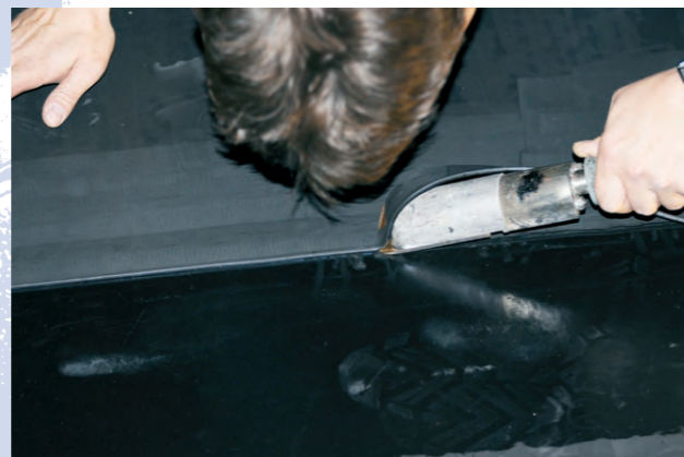
Aplikace pogumování Rubber lining application