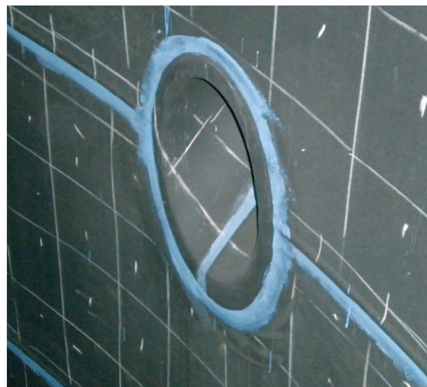
Detail pogumování Detail rubber lining

Aplikací pogumování zajišťujeme velmi přesné povrstvení v agresivním prostředí (ochrana povrchů proti kyselinám, louhům, vodním parám...) do teplot 100 °C.