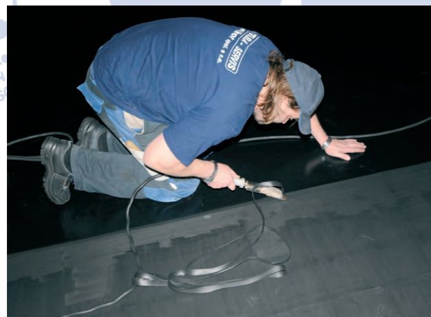
Aplikace pogumování Rubber lining application