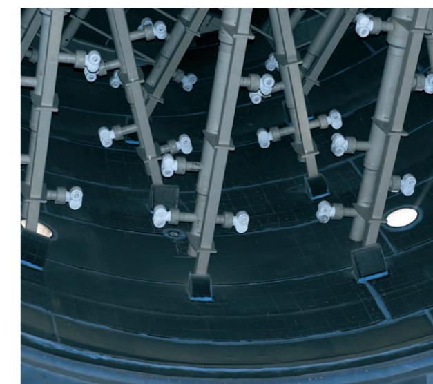
Detail pogumování technologických částí zařízení Detail of equipment technological parts rubber lining