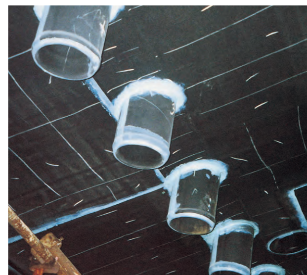
Detail pogumování technologických částí zařízení Detail of equipment technological parts rubber lining

Apply the primer after both surface abrasive blasting and dirt removal; stick the rubber foil with that using appropriate adhesives (various composition, thickness and vulcanization phase - commensurate with chemical load). This foil is thereafter vulcanized suitably by means of steam, hot air, hot iron, or in pressure cooker to create a compact, highly adhesive layer jointly with the undercoat being ready for loading.